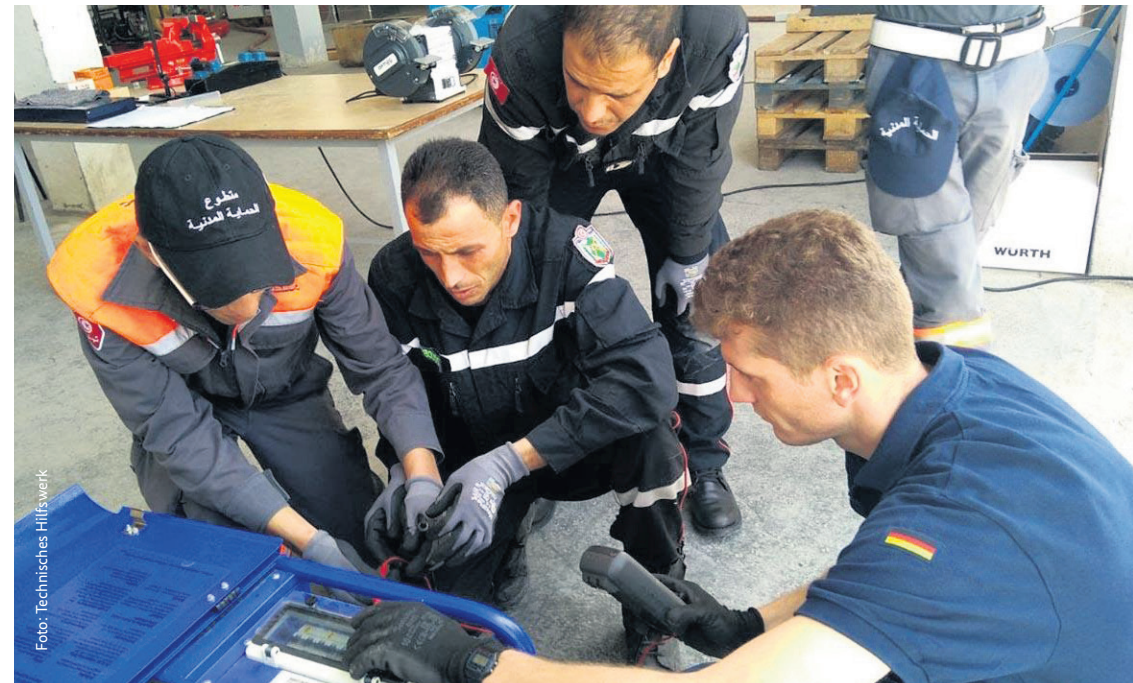
Schirrmeisterausbildung: Ein Ausbilder des Technischen Hilfswerks erläutert tunesischen Technikern die Wartung eines Generators.

Die Ertüchtigungsinitiative ist ein außen- und sicherheitspolitisches Instrument, das gemeinsam vom Auswärtigen Amt und dem Bundesministerium der Verteidigung verantwortet und umgesetzt wird. Sie soll die deutschen Bemühungen stärken, den Sicherheitssektor der Partnerländer und -organisationen während des gesamten Krisenzyklus nachhaltig zu unterstützen. Als ein Instrument der bilateralen und multilateralen Zusammenarbeit wurde die Initiative 2016 ins Leben gerufen und trägt den Herausforderungen Rechnung, die seit Beginn dieses Jahrzehnts mit den Konflikten vom nordwestlichen Afrika bis zum Kaspischen Meer die Sicherheit Europas und auch Deutschlands nachhaltig beeinflussen. Die Initiative folgt den Ansätzen „Hilfe zur Selbsthilfe“ und „partnerschaftliche Beziehungen auf Augenhöhe“.