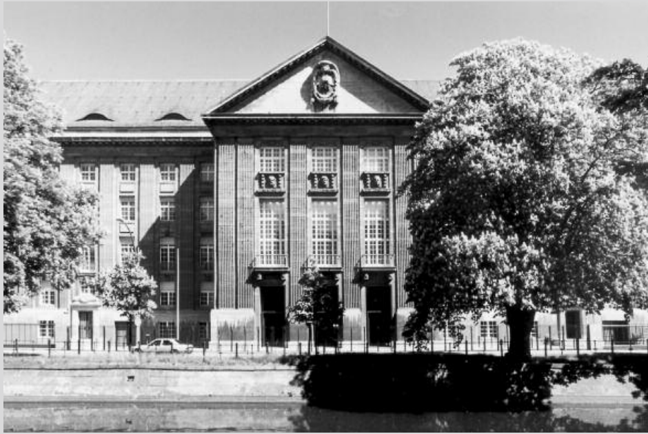
oben: Die historische Fassade des Bendlerblocks – gesehen vom Reichpietschufer. unten: Der Treppenaufgang in der Säulenhalle.