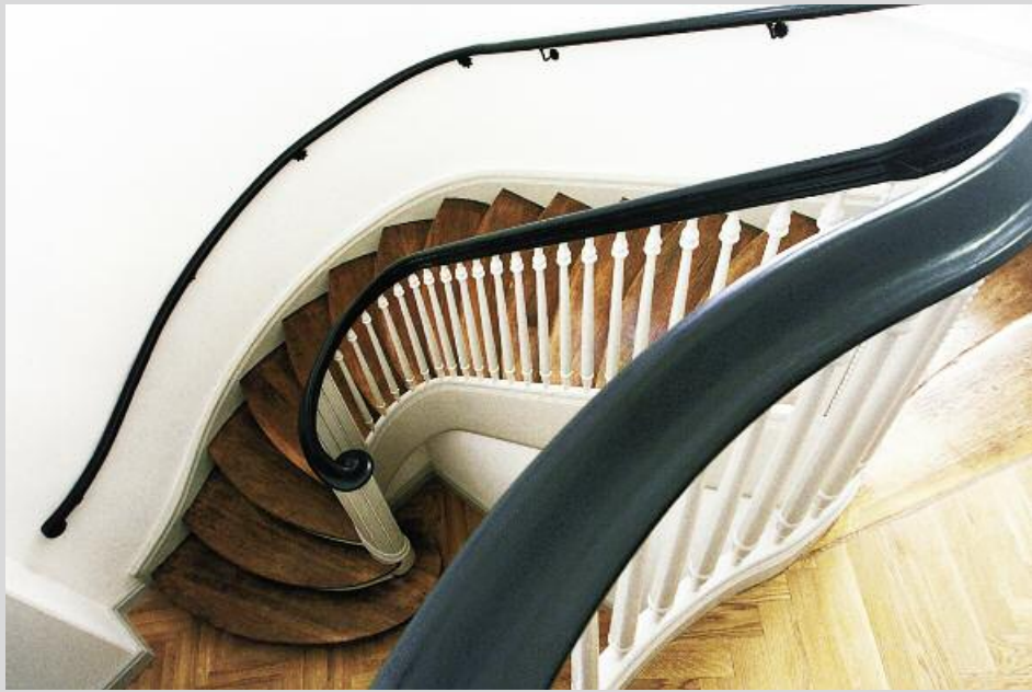
oben: Historisches Treppenhaus. unten: Treppenflur zu den Arbeitsräumen.