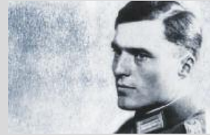
Claus Schenk Graf von Stauffenberg 15. November 1907 – 21. Juli 1944