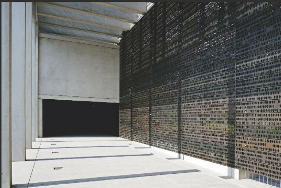
oben: Die bewusst reduzierte Formensprache lässt Raum zur Konzentration und Interpretation. unten: Das Buch des Gedenkens mit insgesamt 20 bronzenen Platten.