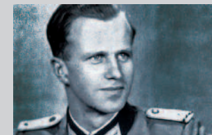
Werner von Haeften 9. Oktober 1908 – 21. Juli 1944

In den späten Abendstunden des 20. Juli 1944 wurde Generaloberst Beck zur Selbsttötung gezwungen und nachdem diese misslang, unmittelbar darauf erschossen.