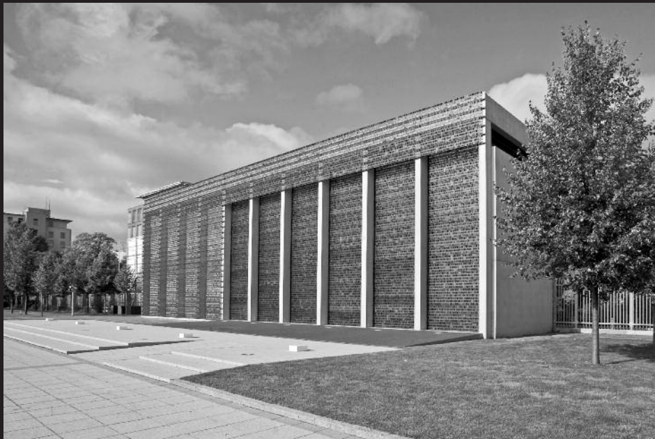
oben: Das Ehrenmal vom Paradeplatz aus gesehen. unten: Die weite Öffnung des Baukörpers zu beiden Schauseiten an der Hildebrandstraße und dem Paradeplatz sowie die vielfach durchbrochene Bronzehülle stehen für Transparenz.