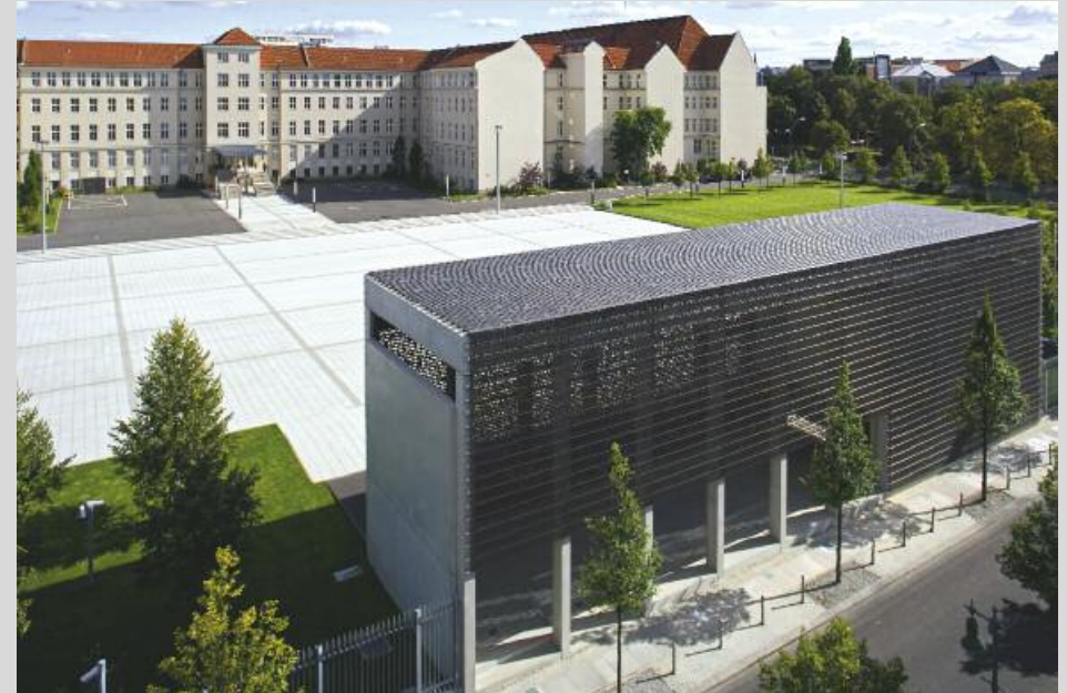
links: Das Ehrenmal vom Paradeplatz aus gesehen. oben: Das Ehrenmal mit Blick auf Paradeplatz und Bendlerblock.