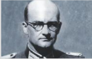
Albrecht Ritter Mertz von Quirnheim 26. März 1905 – 21. Juli 1944