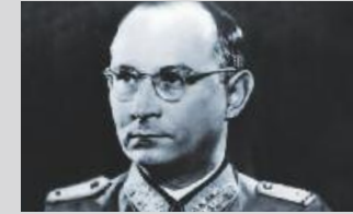
Friedrich Olbricht 4. Oktober 1888 – 21. Juli 1944

Kurz darauf wurde Oberst im Generalstab Albrecht Ritter Mertz von Quirnheim im Hof des Bendlerblocks erschossen.