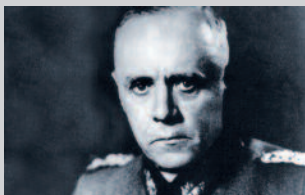
Ludwig Beck 29. Juni 1880 – 20. Juli 1944